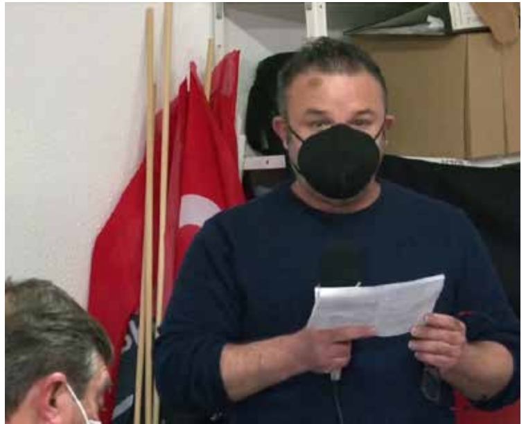
Añoranza por el compañero

Tarde gris nadie en las calles sopla el fuerte viento de levante y cae una fría lluvia el viento nos hace llegar el golpeo del martillo sobre el yunque en la fragua, de pronto suena un estallido con quebranto de muerte que asta el viento en mudeció, en el pueblo los corazones latían y las armas en las manos entre las barricadas quemaban mientras las sombras de la muerte sobre sus cabezas volaba, la libertad estaba acorralada por unas sombras sin sentimiento y enmascarada.