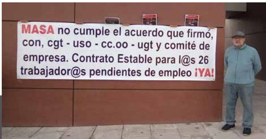
Era su lucha diaria, defender los derechos de los demás

Nadie vive eternamente, pero mientras me quede sangre en las venas y mi corazón palpite, lucharé hasta conseguir que el enemigo caludique