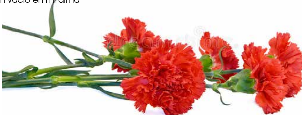
Los claveles lloran tu ausencia

Más de treinta años juntos. Te has ido, mi fiel amigo, dejando un vacío en mi alma